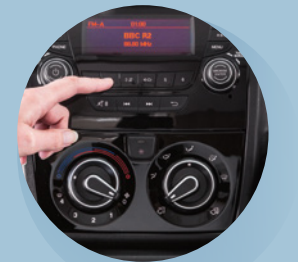
Designad instrumentpanel med helt integrerad fabriksmonterad Stereo/MP3 spelare med Bluetooth, timer som med justering upp till 3 timmar och antenn i backspegeln för bättre mottagning