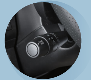
Luftkonditionering bildel och farthållare