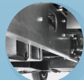
Lågbyggt bredspårigt chassi från AL-KO