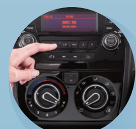
Designad instrumentpanel med helt integrerad fabriksmonterad Stereo/MP3 spelare med Bluetooth, timer som med justering upp till 3 timmar och antenn i backspegeln för bättre mottagning