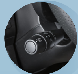
Luftkonditionering bildel och farthållare